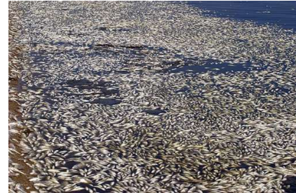
Massasterfte van vissen.

Er ligt vast wel eens een visje op je bord tijdens het eten. Maar is dat over vijftig jaar nog steeds zo? Of happen de vissen de komende jaren naar adem op het strand, zoals in de foto hierboven en blijft er niets meer over voor zeehonden, ijsberen, dolfinnen, zeevogels... en de mens? De afgelopen tientallen jaren nam het zuurstofgehalte in zee op een aantal plaatsen behoorlijk af. Zeedieren krijgen het hierdoor lastiger. Ecosystemen veranderen plaatselijk. En zonder vis verliezen lokale vissers ook hun inkomen.