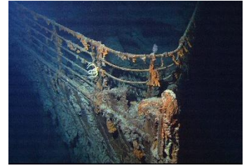
Het wrak van de Titanic op de bodem van de Atlantische Oceaan.

Ijsbergen 'dobberen' daarna met de stroming mee over de oceanen.