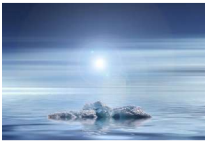
Ijsschots in de oceaan.

De twee belangrijkste oorzaken van de huidige zeespiegelstijging op wereldniveau zijn ijssmelt van de Zuidpool, van Groenland, én het opwarmen van het zeewater . Allemaal veroorzaakt door het opwarmen van de aarde. De oceanen raken dan vlug aangevuld. IJs op de Noordpool smelt ook, maar veel ijs ligt op zee, en smelt daarvan veroorzaakt géén zeespiegelstijging (test dit zelf maar eens met ijsblokjes in een glas water).