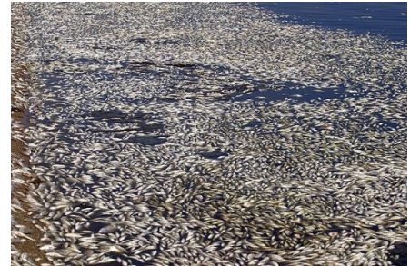
Massasterfte van vissen.

Er ligt vast wel eens een visje op je bord tijdens het eten. Maar is dat over vijftig jaar nog steeds zo? Of happen de vissen de komende jaren naar adem op het strand, zoals in de foto hiernaast, en blijft er niets meer over voor zeehonden, ijsberen, dolfinen, zeevogels... en de mens? De afgelopen tientallen jaren nam het zuurstofgehalte in zee op een aantal plaatsen behoorlijk af. Zeedieren krijgen het hierdoor lastiger. Ecosystemen veranderen plaatselijk. En zonder vis verliezen lokale vissers ook hun inkomen.