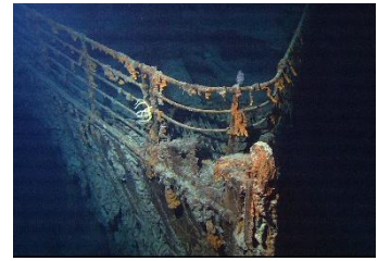
Het wrak van de Titanic op de bodem van de Atlantische Oceaan.

Ijsbergen 'dobberen' daarna met de stroming mee over de oceanen.