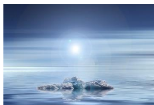
Ijsschots in de oceaan.

De twee belangrijkste oorzaken van de huidige zeespiegelstijging op wereldniveau zijn ijssmelt van de Zuidpool, van Groenland, én het opwarmen van het zeewater . Allemaal veroorzaakt door het opwarmen van de aarde. De oceanen raken dan vlug aangevuld. IJs op de Noordpool smelt ook, maar veel ijs ligt op zee, en smelt daarvan veroorzaakt géén zeespiegelstijging (test dit zelf maar eens met ijsblokjes in een glas water).